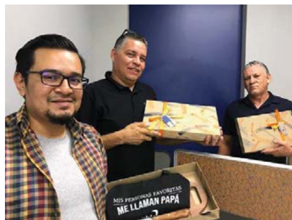
DÍA DEL PADRE