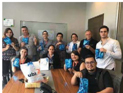
DÍA DEL NIÑO