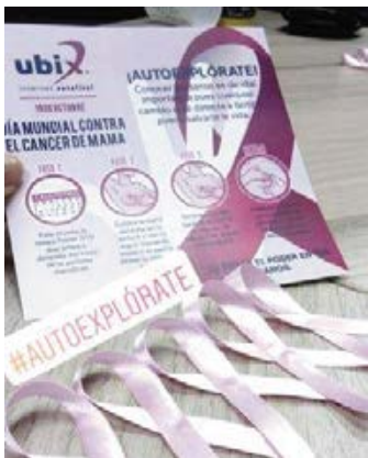
DÍA MUNDIAL CONTRA EL CÁNCER DE MAMA