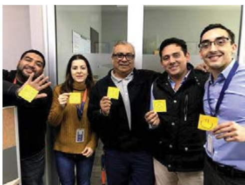
DÍA INTERNACIONAL DE LA FELICIDAD