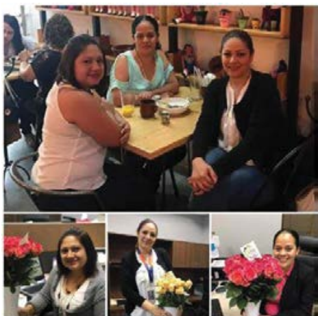
DÍA DE LAS MADRES