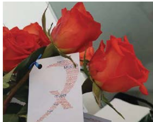
DÍA DE LA MUJER